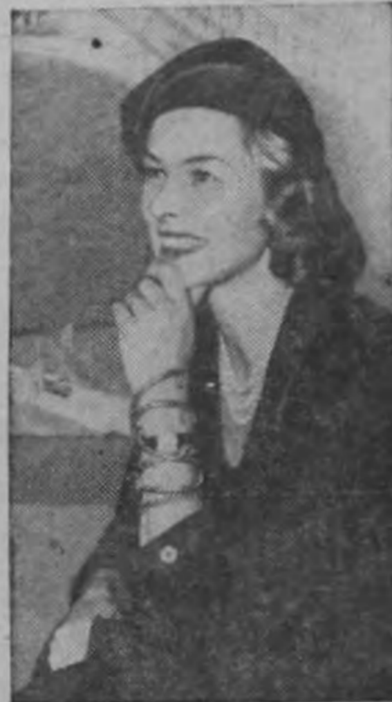
Ingrid Bergman luce feliz y descansada a pesar de 36 horas de constante actividad en Nueva York, mientras espera en el aeropuerto internacional de Idlewild que su avión salga para Europa. La actriz dijo que se sentía "abrumada de emoción" por la recepción que se le hizo.