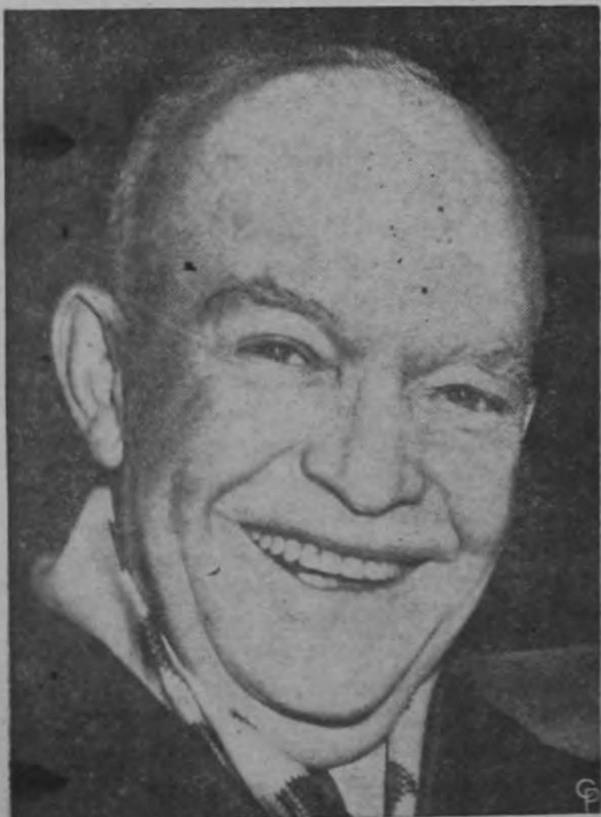
El Presidente Eisenhower se muestra confiado y contento después de prestar juramento en Washington para comenzar oficialmente su segundo periodo presidencial. Tanto el Presidente como el vicepresidente Nixon prestaron juramento dos veces, primero en una ceremonia privada en la Casa Blanca porque la fecha constitucional de la inauguración cayó en domingo, y luego en una pública repelición en el Capitolio, el lunes.