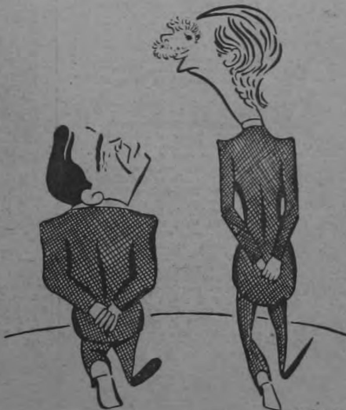
Eden: Me sonaron por agresor. Oreamuno: ¡Qué coincidencia, a mí por caldero-ulatista!