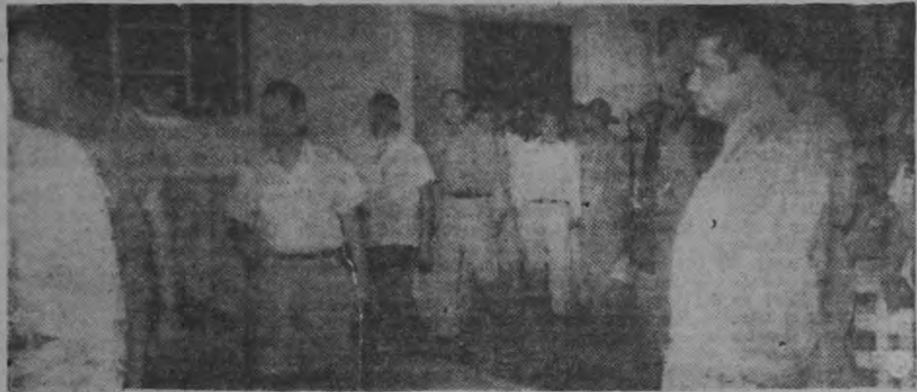
Los reos acusados de complicidad en el magnicidio contra Somoza, asisten a la Sala de "Justicia" en donde se realizó el juicio. La opinión americana ha seguido estupefacta el trámite de este juicio que ha llenado de vergüenza y de opróbio a los pueblos libres.