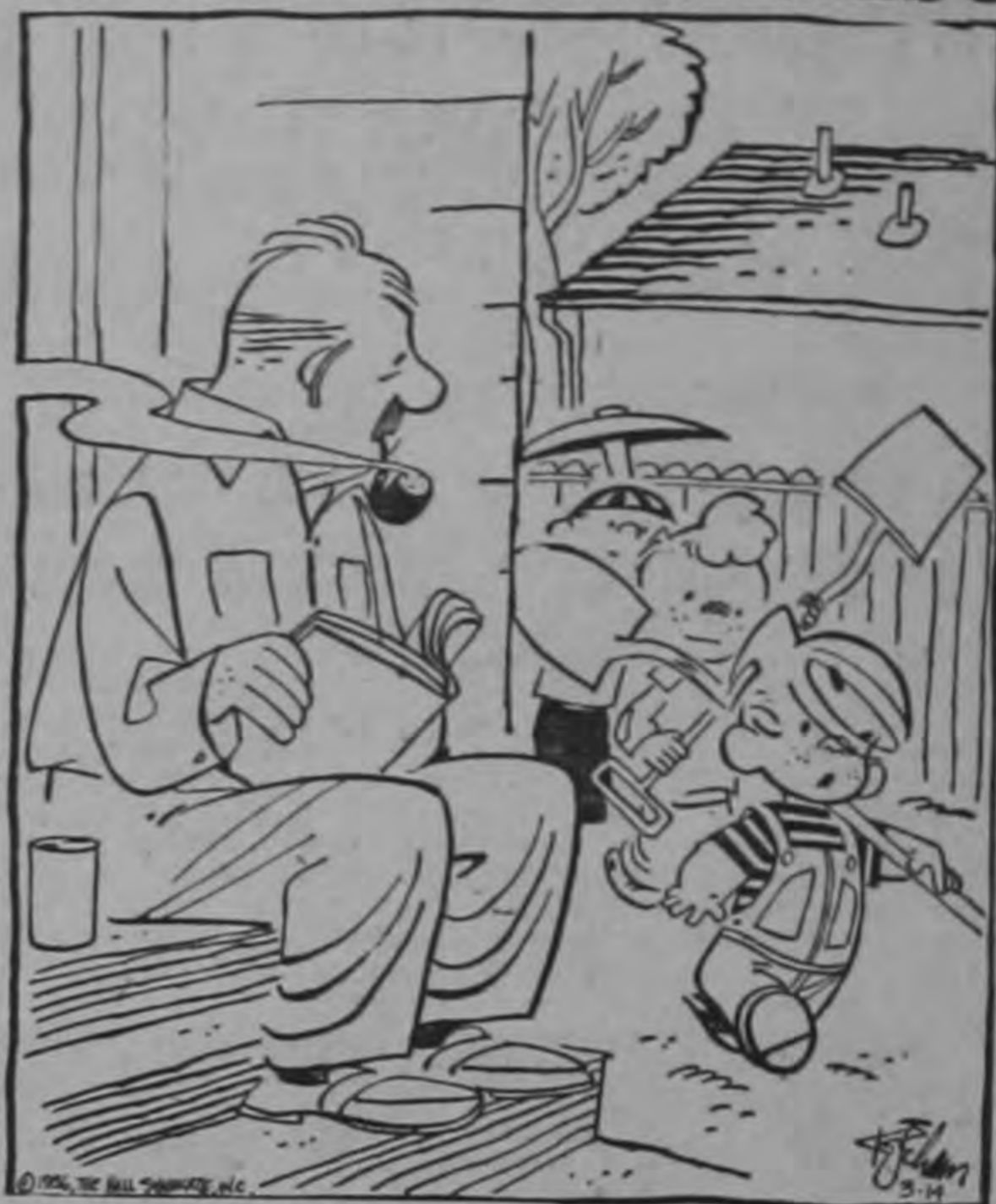
—En el patio de usted no hay ningún tesoro enterrado.—