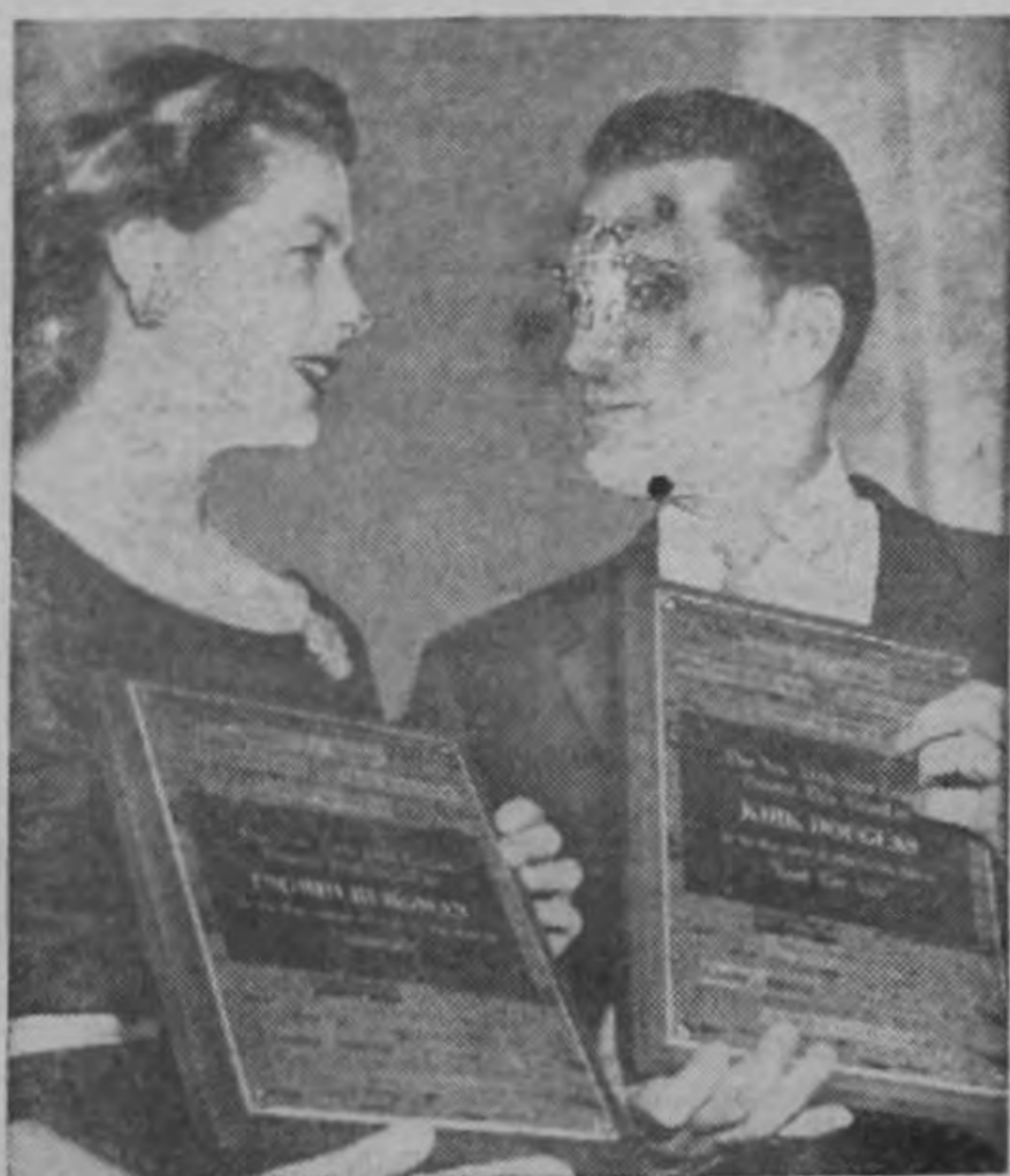
Ingrid Bergman y Kirk Douglas aparecen en Nueva York después de recibir los premios de los Críticos de Cine de Nueva York como la mejor actriz y el mejor actor de 1956. Ingrid hizo el vuelo desde París en su primera visita a los Estados Unidos en 7 años y medio para recibir el premio por su actuación en la película "Anastasia".